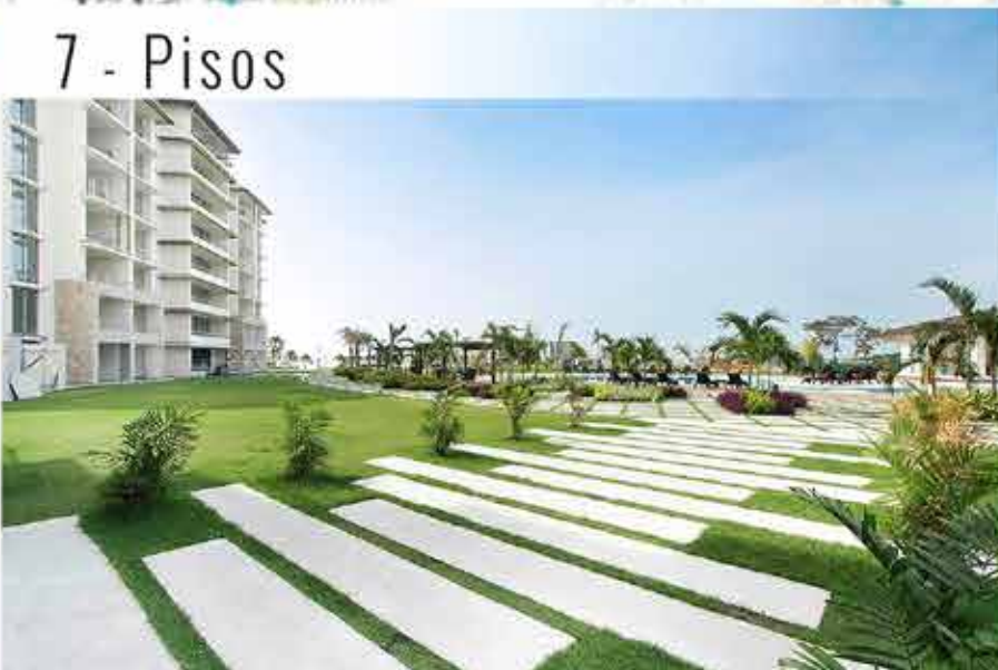
7 - Pisos