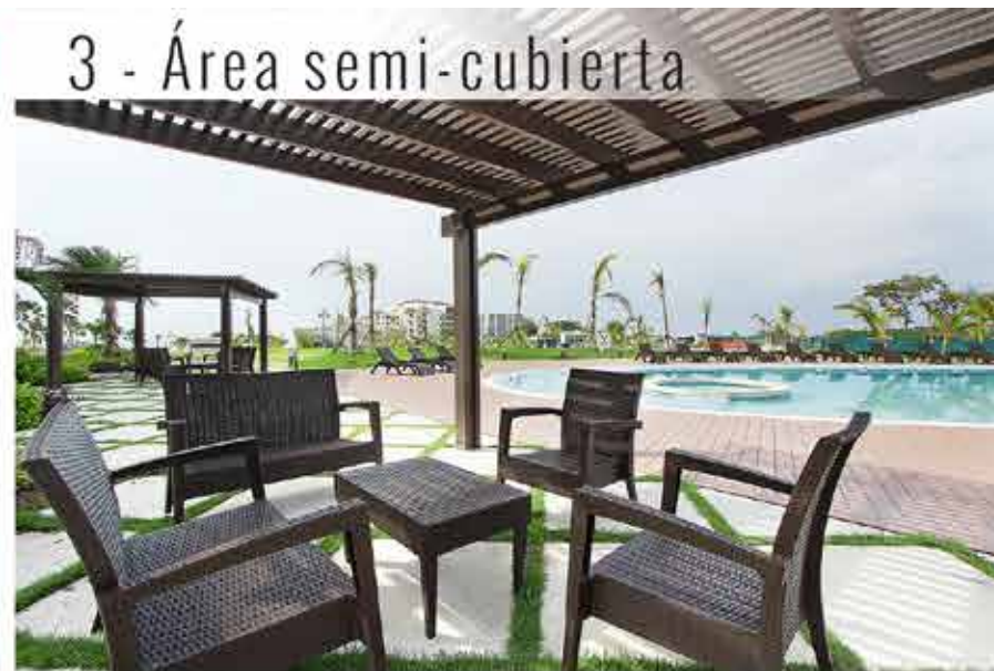
3 - Área semi-cubierta