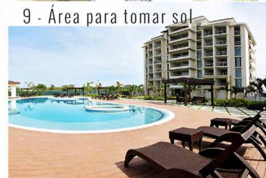
9 - Área para tomar sol