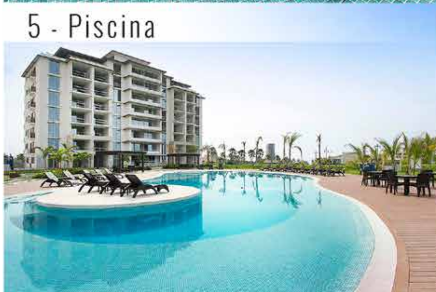
5 - Piscina