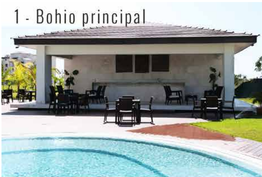
1 - Bohio principal