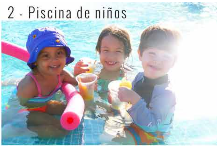
2 - Piscina de niños